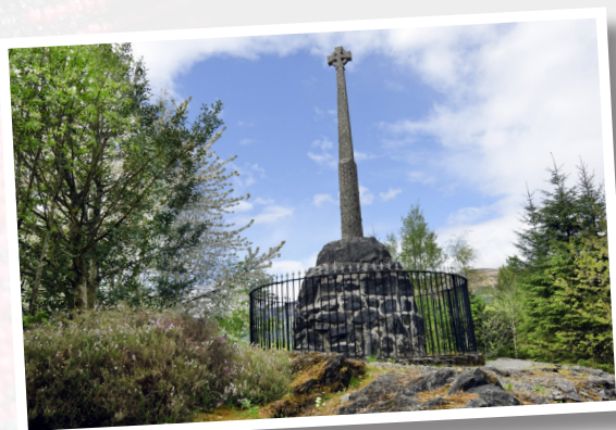
Carragh-chuimhne Murt Ghleann Comhainn