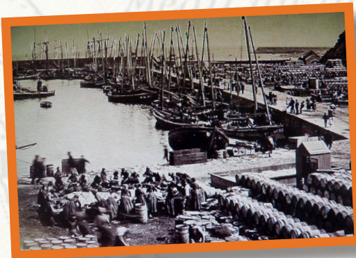
Iasgach an sgadain

Bha aig na bha air fhàgail den t-sluagh ri gluasad gu àiteachan ùra, agus dh'fheumadh iad dòighean ùra ionnsachadh. Bha am fearann agus na lotaichean air an robh iad a-nis ro bheag airson bith-beò a thoirt do dhaoine agus le sin thòisich na croitearan ag obair ann an gnìomhachasan eile.