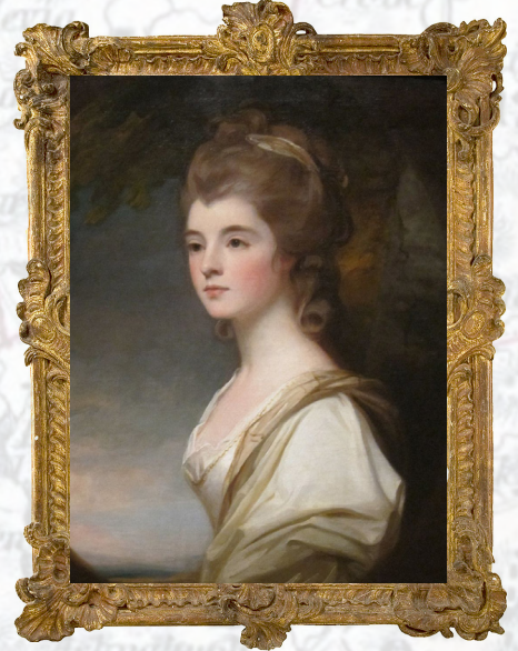
EALASAID GHÒRDAN, BAN-IARLA CHATAIBH