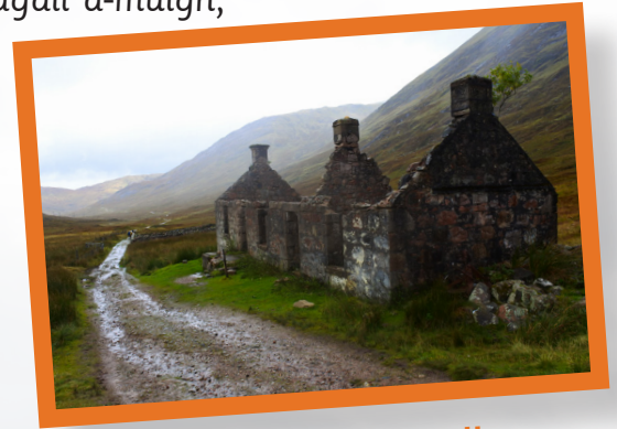
Taigh croiteir air a losgadh

Chaidh taighean nan croitearan agus bailtean slàn a chur nan teine gus nach b' urrainn duine fuireach annta.