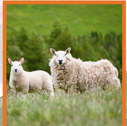
Caoraich mhaola Cheviot

Chaidh caoraich mhaola Cheviot a thoirt a-steach an àite nan caoraich dhùthchasach mar na caoraich dhubh-cheannach. Tha na caoraich mhaola cruaidh agus faodaidh iad a bhith a-muigh air a' mhonadh fad na bliadhna. Le sin, tha iad gu h-àraidh freagarrach airson monaidhean na Gàidhealtachd.