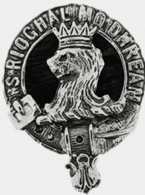
Clann MhicChoinnich air Ghàidhealtachd