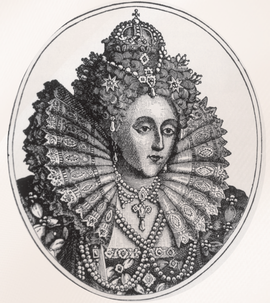
Banrigh Ealasaid I

Thàinig atharrachadh ann an 1603 nuair a chaochail Banrigh Ealasaid Shasainn.