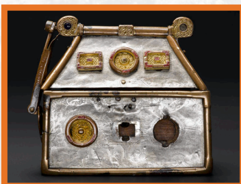
Taisealan Mhonymusk a tha ann an Taigh-tasgaidh Nàiseanta na h-Alba.

A rèir aithris, aig aon àm bha cuid de chnàmhan Cholm Cille no nì a' buntainn dha anns an taisealan , a tha ann bho mu AD 750.