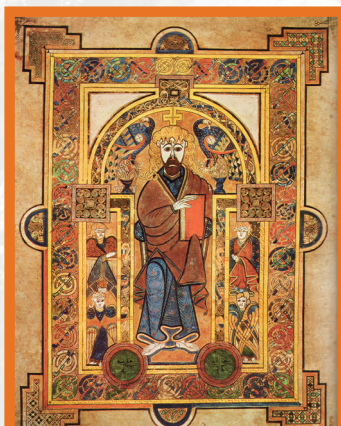
Soisgeulan an Eilein Naoimh.

Tha an obair-cheàirde agus an obair chruthachail aige ri fhaicinn ann an Leabhar a' Cheannanais agus ann an Soisgeulan an Eilein Naoimh .