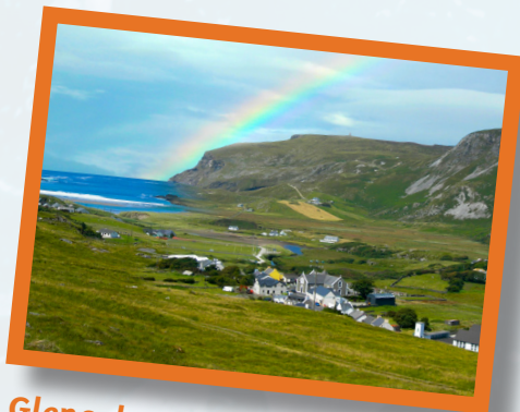
Glencolmcille, Dùn nan Gall