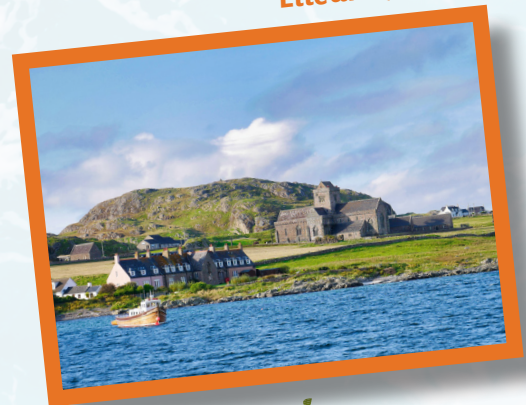
Eilean Ì, Alba

Rinn iad an dachaigh ann an Eilean Ì, a bha aig an àm sin na pàirt de Dhalriata, rìoghachd Ulaidh .