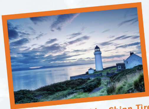
Taigh-solais air Rubha Chinn Tìre

Bhiodh malairt a' dol air adhart thar a' chuain eadar muinntir a' Chost an Iar agus muinntir na h-Èireann.