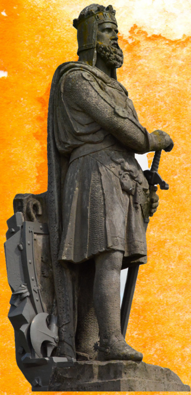
Iomhaigh Raibeirt Bhruis ann an Sruighlea

Tha e coltach gun robh Raibeart Brus , Rìgh na h-Alba eadar 1306-1329, airson gun deigheadh na h-Èireannaich còmhla ris na h-Albannaich leis gun robh an aon eachdraidh, na h-aon chleachdaidhean agus an aon chànan aca.