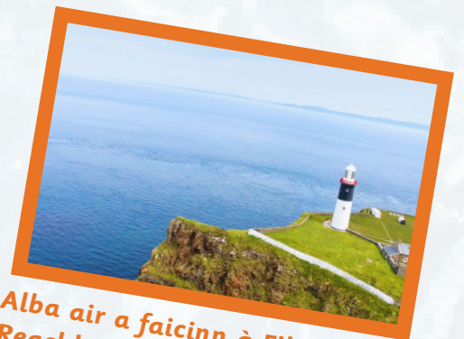
Alba air a faicinn à Eilean Reachlainn, Contae Aontroma