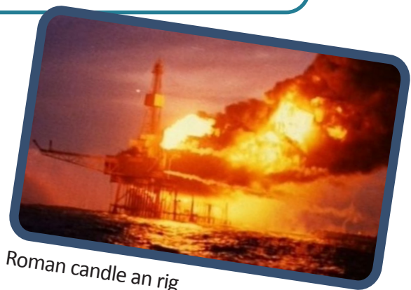
Roman candle an rig

Nuair a tha sibh ag èisteachd ris na buidhnean eile, dèanaibh notaichean agus faodaidh sibh ceistean fhaighneachd nuair a tha iad deiseil.